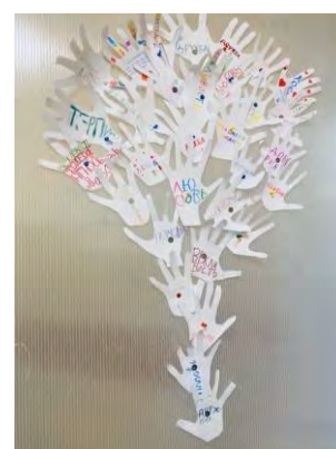
занятие «Дерево толерантности»